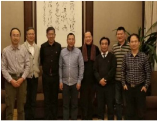
顶尖农业代标交流