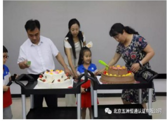
公司成立十五年活动